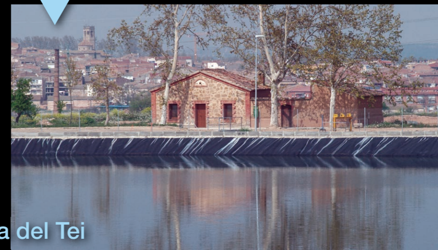
La Casella del Tei

En aquest indret hi podem observar la recent construcció d'un gran embassament que regula l'eficiència del canal en el seu tram final.